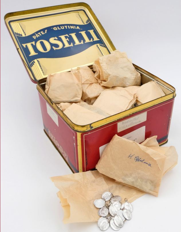
Medailles van de heilige Apollonia, 2de helft 20ste eeuw – Leuven, PARCUM, collectie zusters augustinessen Brugge (Sint-Janshospitaal)

In sommige streken werden aan de beeltenis van de heilige Apollonia zijden koordjes uitgedeeld als bescherming tegen tandpijn, soms gewijd water om de tanden mee te poetsen en kiespijn te voorkomen. Ex-voto's tonen zich in de vorm van losse tanden, tandensnoeren of hele gebitten in was. In het Oost-Vlaamse Elst worden op 9 februari, haar feestdag, ovenkoeken of geutelingen gebakken en uitgedeeld; bijten in een hete geuteling betekent een jaar lang geen tandpijn. En ook wanneer kinderen een tand verloren, bestond het gebruik om voor een beeld van de heilige Apollonia de tand over de schouder te gooien en te zeggen: "Tand, tand, een andere tand, volgend jaar een nieuwe tand".