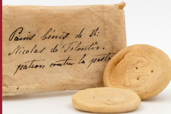
Twee gezegende broodjes van de heilige Nicolaas van Tolentino – Leuven, PARCUM, collectie zusters clarissen Loonbeek

Specifiek voor West-Vlaanderen is zijn verering tegen wat men in de volksmond 'koek' of 'hartgespan' noemt, een tuberculeuze opzwellende en verharding van het buikvlies. Zieken offerden geldstukken, werden gezegend met zijn relieken en kregen gewijde broodjes mee waarvan ze gedurende negen dagen moesten eten. De broodjes werden ook aangewend tegen onvruchtbaarheid en aangeboden aan vrouwen in barensood. Maar niet alleen de mens was gebaat bij de broodjes, ze werden ook vermengd met het veevoeder en moesten de dieren beschermen tegen veeziekten in het algemeen en mond-en-klauwzeer in het bijzonder.