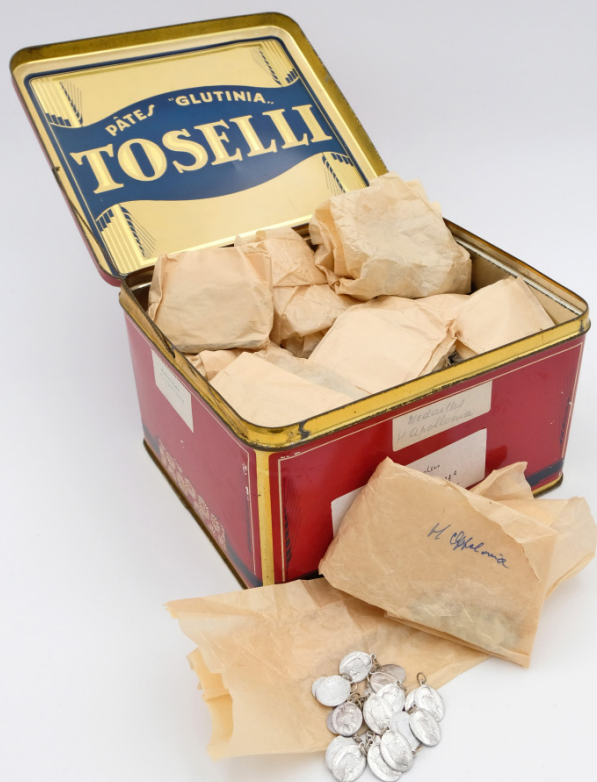
Medailles van de heilige Apollonia, aluminium, 2de helft 20ste eeuw – Leuven, PARCUM, collectie zusters augustinessen Brugge (Sint-Janshospitaal)

'Op hoop van zegen' geeft een beeld van de rijkdom aan geneesheiligen in Vlaanderen, hun verering, en de rituelen en gebruiken die daarmee verbonden zijn. En deze focusexpo is actueler dan ooit. De huidige corona-epidemie heeft ons opnieuw geconfronteerd met onze kwetsbaarheid. En hoewel dit onder andere geleid heeft tot een hernieuwde belangstelling voor de heilige Corona, heeft zij niets met epidemieën te maken. Al leert deze expo ook dat de verering van heiligen doorheen de geschiedenis verrassende wendingen kan nemen.