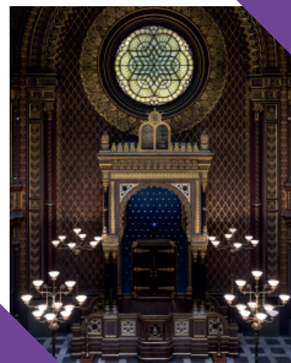
De heilige ark