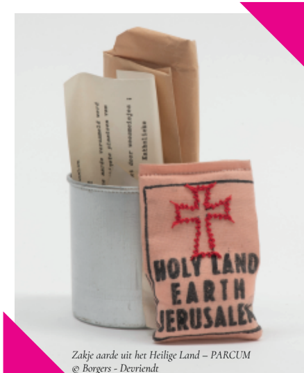
Zakje aarde uit het Heilige Land – PARCUM © Borgers - Devriendt