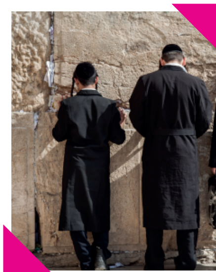
Westelijke muur (Klaagmuur)