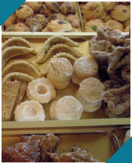
Suikerfeest (Eid al-Fitr)