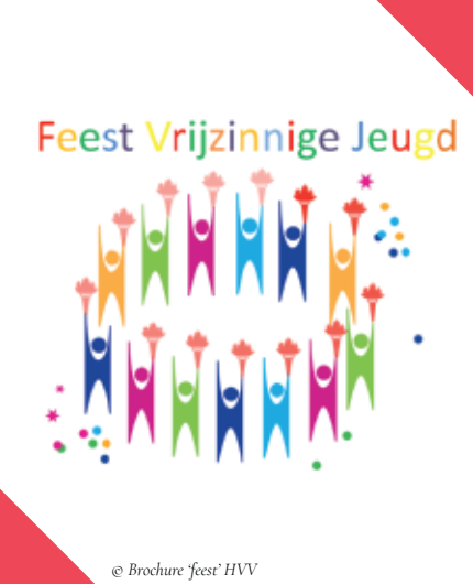
Feest vrijzinnige jeugd