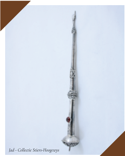
Jad - Collectie Stiers-Hoogewys