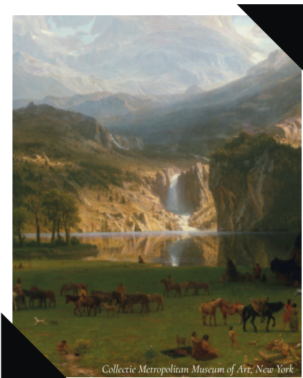
Collectie Metropolitan Museum of Art, New York