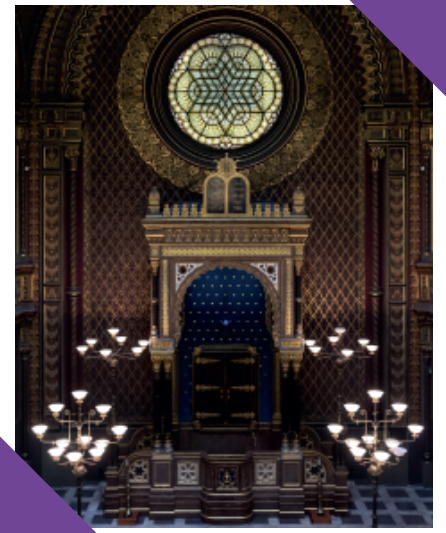
De heilige ark