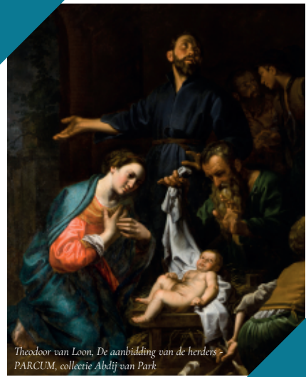
Theodoor van Loon, De aanbidding van de herders - PARCUM, collectie Abdij van Park