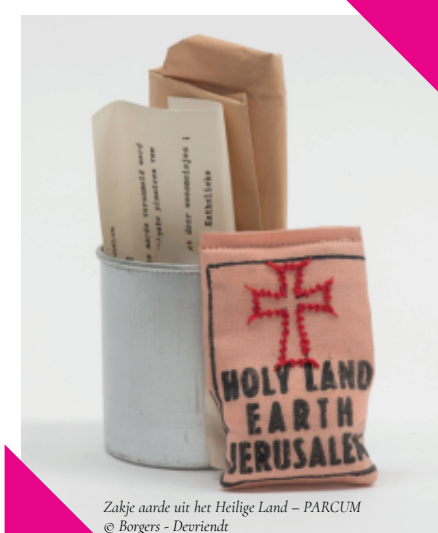
Zakje aarde uit het Heilige Land – PARCUM © Borgers - Devriendt