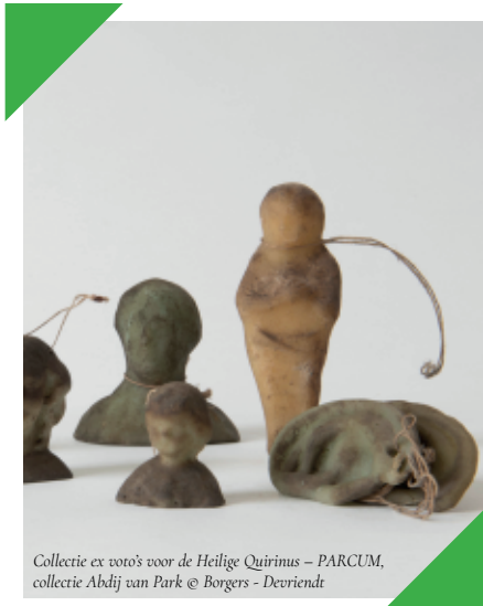
Collectie ex voto's voor de Heilige Quirinus – PARCUM, collectie Abdij van Park