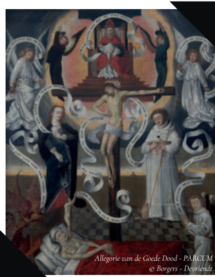
Allegorie van de Goede Dood