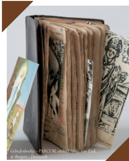
Gebedenboekje - PARCUM, archief Abdij van Park