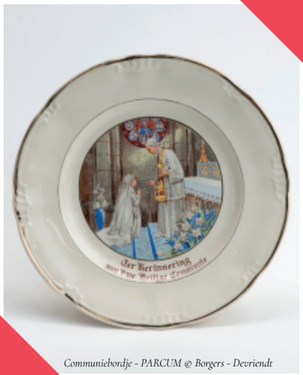
Communiebordje - PARCUM © Borgers - Devriendt