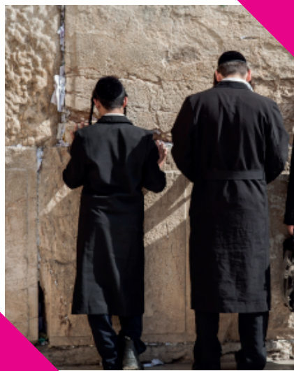
Westelijke muur (Klaagmuur)